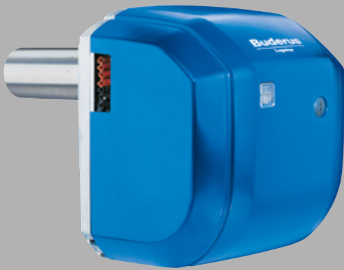
Anbaubrenner Logatop BE-A